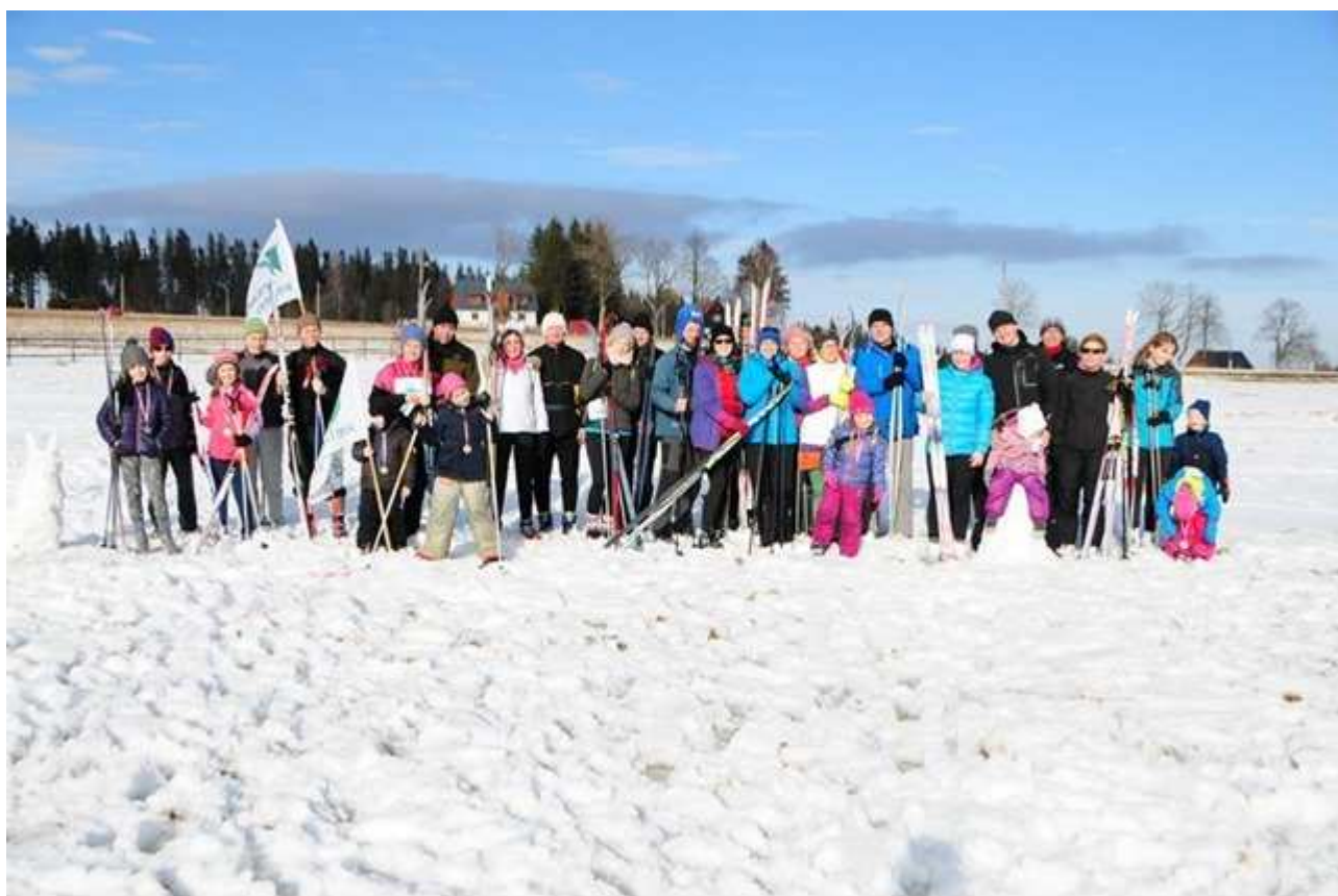
Uczestnicy poprzedniej edycji Mistrzostw Polski Lekarzy Weterynarii w Narciarstwie Klasycznym

Zapraszamy serdecznie lekarzy weterynarii na zawody w biegach narciarskich, które zostaną rozegrane 27 stycznia 2018 r. w Rejviz (12 km od przejścia granicznego Konradów/Złate Hory). Zapowiada się świetna zabawa, uczestnicy naszych pierwszych Mistrzostw Polski w Narciarstwie Klasycznym potwierdzają wspaniałą atmosferę zawodów i fun na ceremonii w Ferovce. Zważając na fakt, że aktywność sportowa jest obecnie promowana nie tylko w mediach, ale również na każdym poziomie edukacji i życia społecznego, jest przez to oczekiwaną formą aktywności samorządu lekarsko-weterynaryjnego. Takie działanie promuje wizerunek lekarza weterynarii akceptującego zdrowy styl życia i zachowujący proekologiczny stosunek do otoczenia.